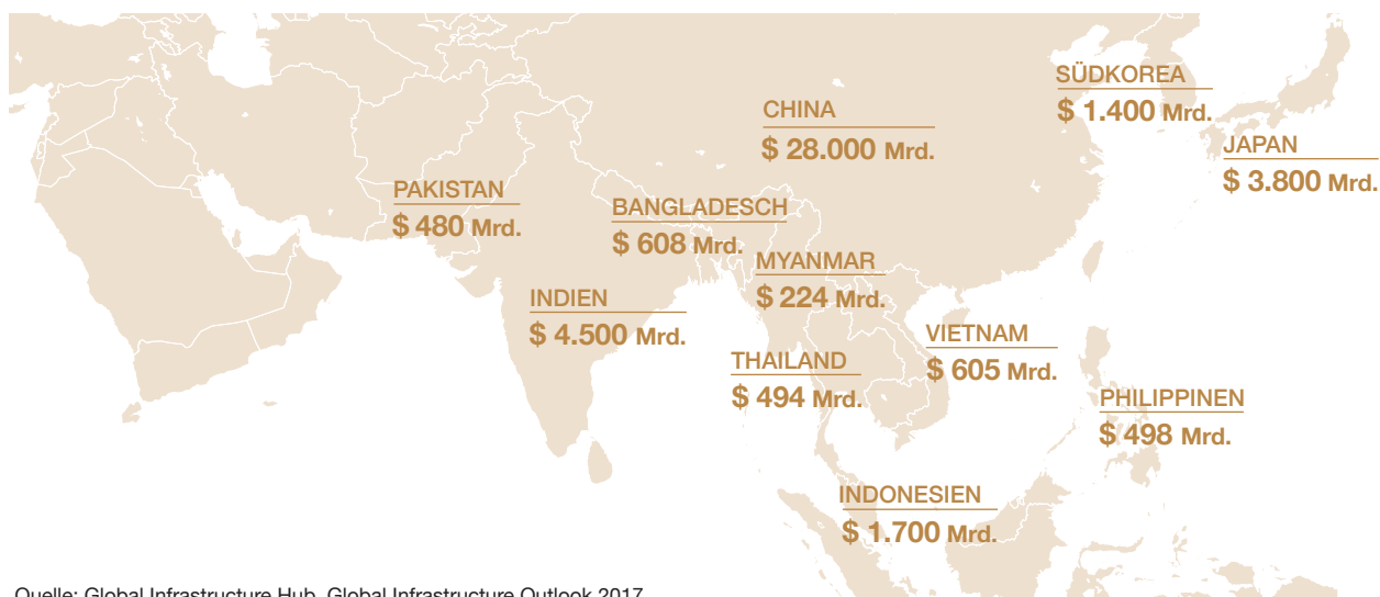
Der Infrastrukturbedarf in einzelnen Ländern Asiens von 2007 bis 2040 (ohne UN-Nachhaltigkeitsziele)